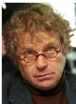
Zionist Daniel Cohn Bendit

Weiterer wichtiger Auszug aus dem Bericht von Eva Herman: